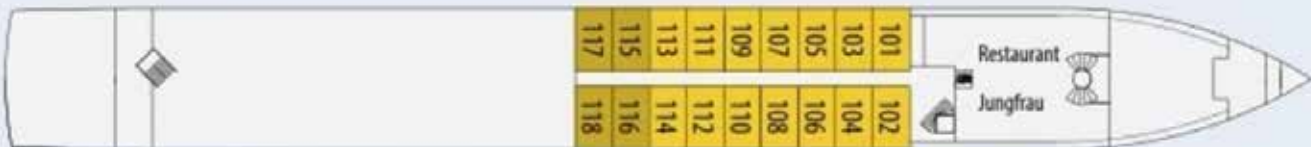
Hauptdeck / Smaragdeck